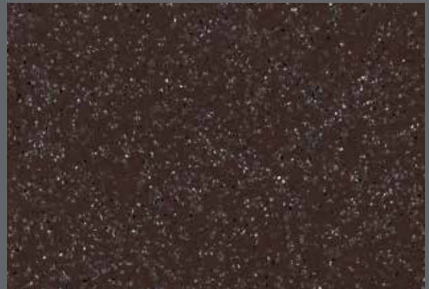
Walnut | X4086 WR62 / A1M62 / LRV 10