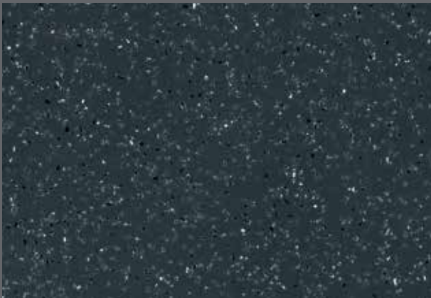
Anvil | X4094 WR101 / A1M72 / LRV 11