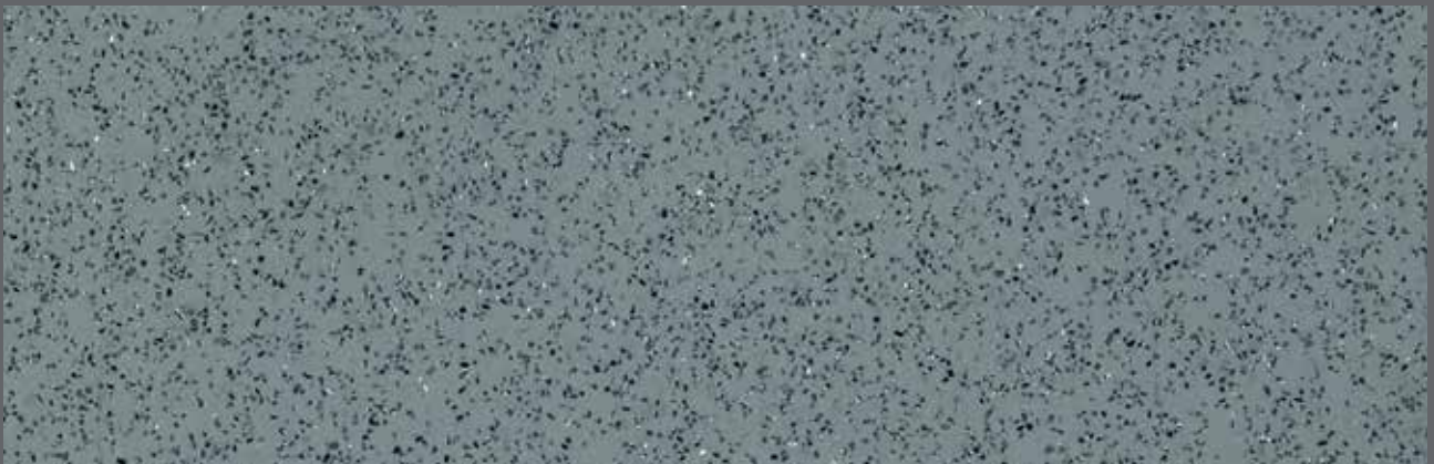
Pewter Grey | X4039 WR81 / A1M81 / LRV 26